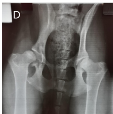
Figura 2: Radiografia ventrodorsal da articulação coxofemoral.

Foram observadas, ainda, as bordas acetabulares craniais achatadas com discretíssima proliferação osteofítica, a qual foi sugestiva de uma doença degenerativa articular. As cabeças femorais encontravam-se discretamente alteradas com sinais de proliferação osteofítica adjacente à cabeça femoral direita, além de colos femorais ligeiramente espessados e preservação da articulação sacrílica, bilateralmente (Figura 2).